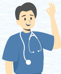
Auxiliar de enfermería

Luego de definir los territorios y microterritorios, se deberá definir la adscripción e integración de los EBS a dichos territorios, teniendo como referencia los siguientes perfiles esenciales: