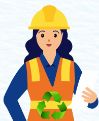
Técnico (tecnólogo) en saneamiento ambiental

Estos perfiles podrán vincularse para hacer parte de varios EBS con el fin de realizar acciones relacionadas con el PICP: