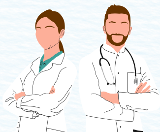
Especialidades básicas (Medicina familiar, Medicina interna, Pediatría, Ginecología, Psiquiatría, entre otros).

Estos perfiles podrán vincularse para hacer parte de varios EBS con el fin de realizar acciones relacionadas con el PICP: