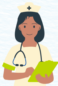
Profesional de enfermería