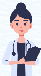
Profesional en Psicología