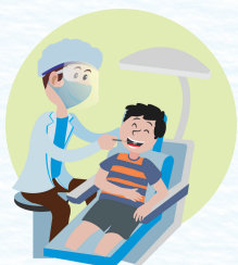
Auxiliares en salud oral