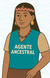
Agente de la medicina ancestral/tradicional en territorios con grupos étnicos

Debe ser reconocido y avalado por las mismas comunidades.