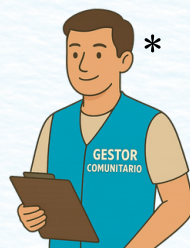
Agente/gestor comunitario o promotor de salud