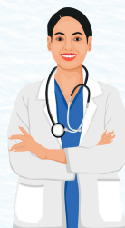
Profesional de medicina