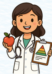
profesionales en Nutrición y Dietética

De acuerdo a las necesidades y particularidades del territorio, podrán integrarse al EBS otros perfiles como: